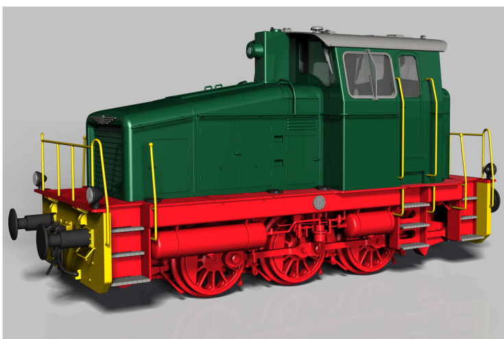
ML 500 C Modell in H0 (3D CAD - Zeichnung)