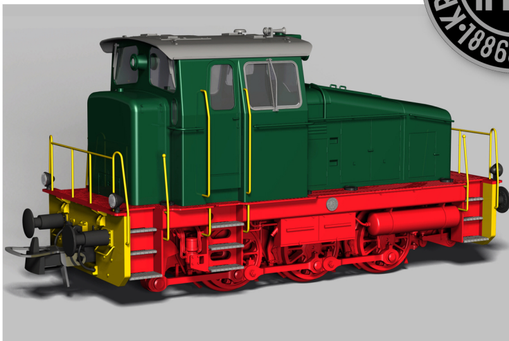
ML 500 C Modell in H0 (3D CAD - Zeichnung)